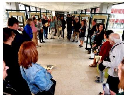
pohled do Galerie Na Mostě

♣Přehlídku Žní EXL lze navštívit do 4. 4. 2025. ■