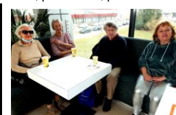
Šulcovi s jejich kamarádkou