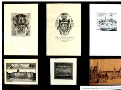
první heraldická exlibris (1725) a nejstarší zobrazení H.K.