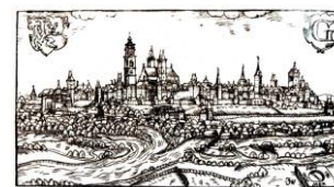
historické exlibris Hradce Králové