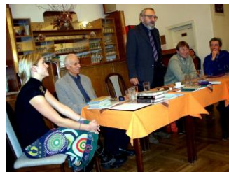
2009 Lanškroun - Zámek, SVČS

Ročník XIV., vyšlo 22.března 2025. Redakce a spolupracovníci, Homepage: