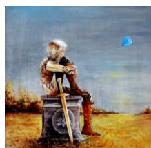
Janička z pArku