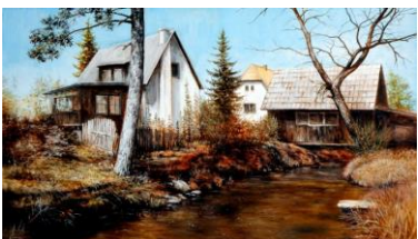
Svratka v Křížánkách