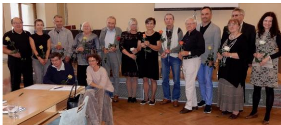
2021 Pardubice - Magistrát města, křest Sborníku SVČS