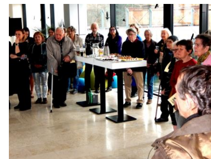
návštěvníci v Galerie Na Mostě