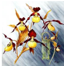
Zlato Velké Moravy